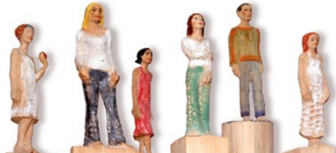
Bildmotiv: Michael Pickl/Bildhauer